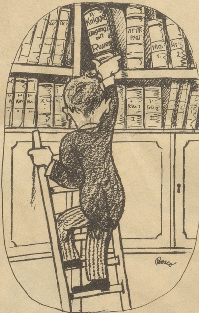
Dr. Max Petitpierre hat sein Amt als Bundesrat angetreten

Schreib' es Dir auf, ja nicht vergessen: Im „Central“ kannst Du prima essen.