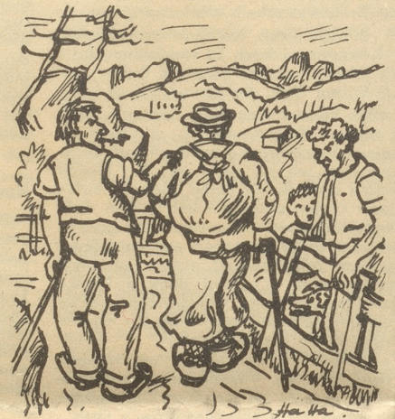
Er ließ mich vorläufig nicht mehr los, so trampelten wir auf dem Weglein weiter . . .

Mit einigem Räusperrn kramte der Vetter Polizeier in seinen Papieren herum; plötzlich brüllte er mich an: «Verhör —, Name, Ausweis-