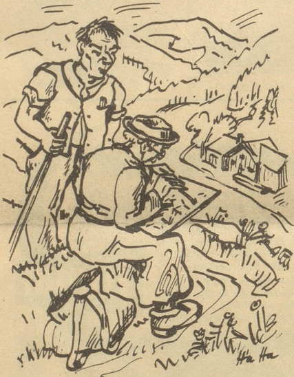
Einige Minuten sah er zu, wie ich mit pflatschnassem Pinsel . . .

Saß ich da an einem lieblichen Herbstnachmittag des Jahres 1942 im Appenzellerland, oder näher bezeichnet im Land meiner Väter, an einem einsamen Wegbürdchen und ließ mir die Sonne auf den Buckel brennen. Auf meinen Knien lag mein aufgeschlagenes Skizzenbuch, im Gras Farbschachtel und Wasserbecher. Ich machte mich eben daran, das Heimwesen, das unten in der Mulde lag, meinem Skizzenbuch einzuverleiben. Mit spitzbübischer Freude kleckste ich die blauen und roten Farben ins grelle Wiesengrün. Einige freche Pinselstriche und der Bauer, der unten am Brunnen die buttergelben Milcheimer wusch, und die Bäuerin, die Wäsche aufhing, waren zu Papier gebracht. Auf einmal kam mir zu Bewußtsein, wie sauwohl mir eigentlich war, hinten die Sonne und vorne unter mir die friedliche Mulde, — ich vergaß die ganze übrige Welt mit samt dem blödsinnigen Krieg! Aber oha, diese Stunde ungetrübten Glückes