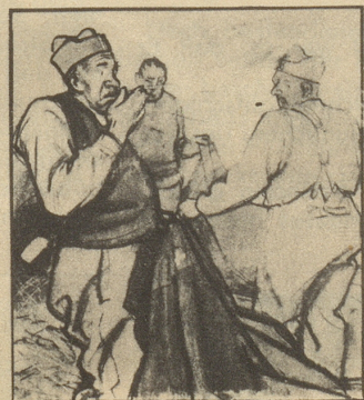
Und nun beginnt das übliche Morgen — Hust-Konzert — fast so unvermeidlich wie der weckende Korporal. Das kommt natürlich von dem langweiligen Strohstaub!