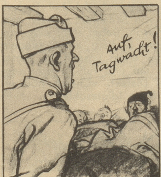
„Mitten in der Nacht“, seufzt Peter. „Der Korporal hätte uns wohl noch ein paar Stunden drein geben können!“

Noch gefährlicher aber ist es, ihn in Unkenntnis über das eine und andere zu lassen. Blaise Pascal, 1623—1662.