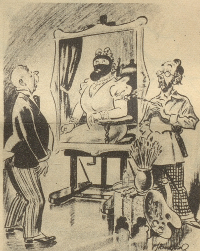
«Unglücklicherweise war gerade Fliegeralarm, als ich Ihre Frau malte.» Illustrated

Es herrschte ein Moment Todesstille! der Offizier konnte aber sein Lachen nicht mehr unterdrücken; auch wir übrigen Mitreisenden nicht. C. B.