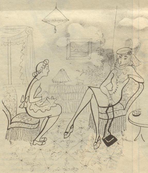
Die neue Hausgehilfin

«Wüssezi, das isch nüt für euserein. Bim Mikroskopiere simmer mini Ouge-wimpere schtändig im Wäg gsy.»