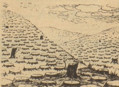
Die «TIMES» versichert, daß die Engländer alles tun für den wirtschaftlichen Wiederaufbau Italiens.