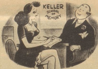
Kellers Gedächtnisschule «Ah — lassen Sie einmal sehen, wo wir waren!» Esquire