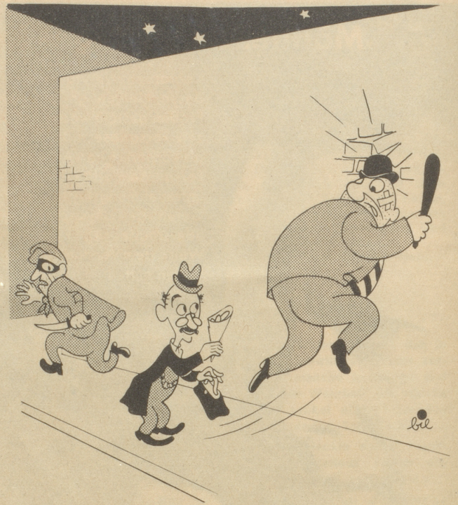
Künftiges Paris bei Nacht Atombomben gefällig?