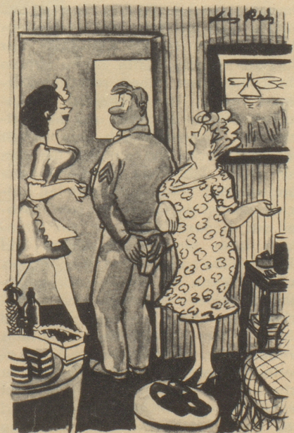
«Aber mein lieber Sohn, all die Dinge, die Du entbehrt hast, sind hier!» Esquire