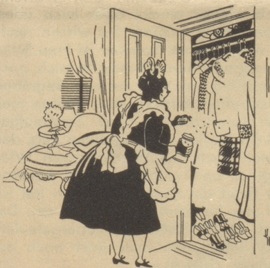
«Fliegt hinein, ihr Motten, und sucht mir ein schönes Kleid aus!» Collier's