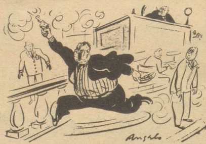
«Hurra, ich bin freigesprochen worden!» Esquire