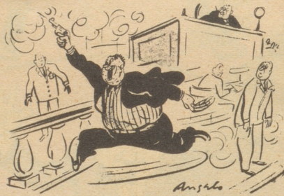
«Hurra, ich bin freigesprochen worden!» Esquire