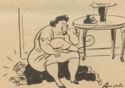
«Ich möchte Ihnen melden, daß bei mir ein Raubversuch stattgefunden hat.» Esquire