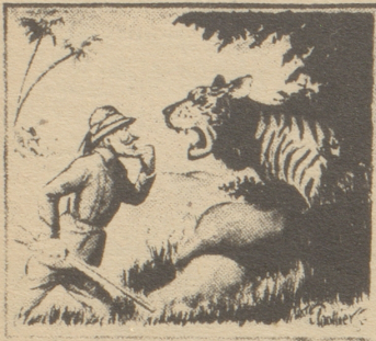
Zahnarzt: «Sofort sollten diese Zahnstummel entfernt werden.» Life