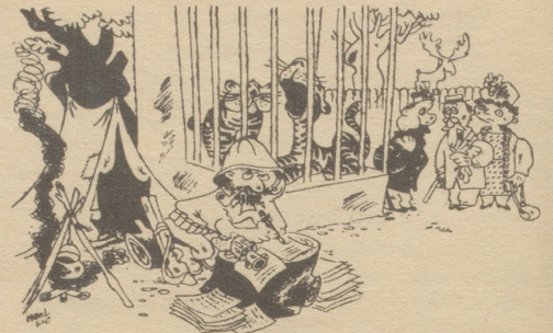
Der Schriftsteller, der im Zoo die Atmosphäre des Dschungels spürt.