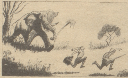
Der Photograph: «W-w-was hescht gseit?» Der Jäger: «I ha-ha gseit — g-g-gemmer üs lieber mit dem do nüd ab.»