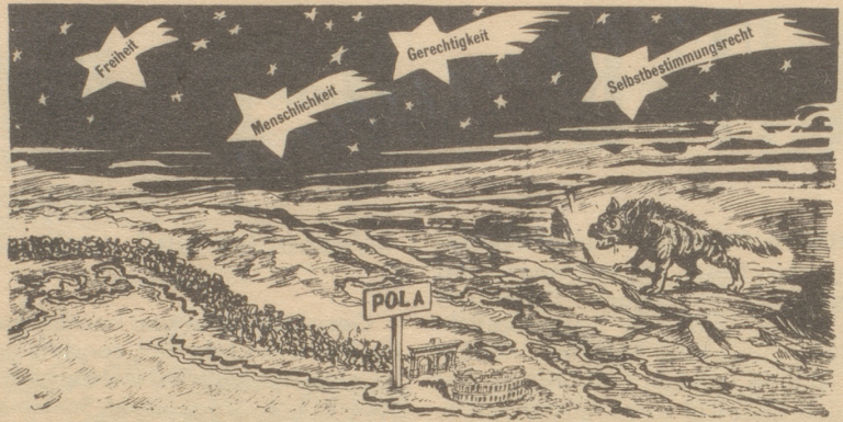
Pola, der jugoslawisch-italienisch-britisch-russisch-amerikanische Zankapfel