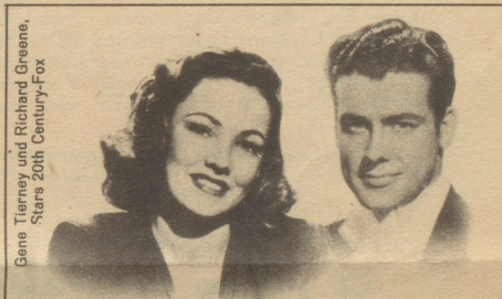
Gene Tierney und Richard Greene, Stars 20th Century-Fox