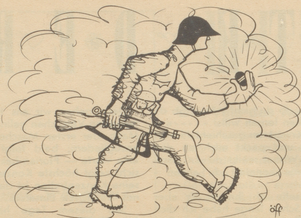
Wolken-Kämpfer (Gladiator im siebten Himmel)

öff grüßt aus dem WK. (Obacht ... das Verdächtige in der linken Hand ist eine blinde Uebungs-Defensivatombombe „H-H-H 1947“!)