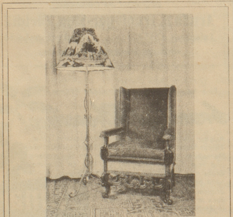
Einrichtungen in alten Stilarten Einzelanfertigungen und Kleinmöbel

Rohé A. S. Zürich Stilmöbel. Fraumünststr. 23.