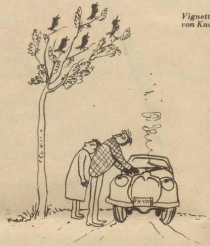
Vignetten von Knorr

die Motorenhaube, starrte eine Weile tiefsinnig auf den weiterzwitchernden Motor und kam zum Schluß: «Es ist eine Kerze.» Mit einem Griff durchs Fenster stellte er den Motor ab, aber siehe, es zwitscherte verstärkt weiter. Und dann kam uns die Erkenntnis: auf den Bäumen längs der Straße hatten sich hunderte von Staren niedergelassen und sangen und trillerten gemeinsam in den schönen Sonntag hinein.