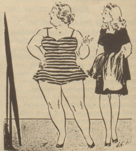
„Findet Sie nüd Schtreife mached dick?“ Tyrihans, Oslo

Eines war aber doch betrübend: während dieses Herumrennens hatte ich den anderen Schuh, den ich immer in Papier eingewickelt mit mir herumschleppte, irgendwo liegen lassen, — leider nicht im Tram! Wo sollte denn der gesucht werden... Nun, ich besitze wenigstens den ersten, habe ihn aufs Buffet gestellt, um ihn immer vor Augen zu haben, und sehe ich ihn an, so wird mir jedesmal leicht ums Herz: «Solch einen gut funktionierenden Apparat, wie das Tram-Fundbüro, gibt es sicher doch nur in unserem fortschrittlichen Sowjet-Land!» (übers. v. O. F.)