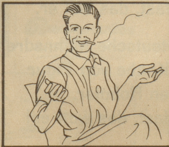
Und Sie werden seine Wirkung verstehen.