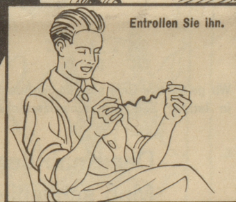
Entrollen Sie ihn.