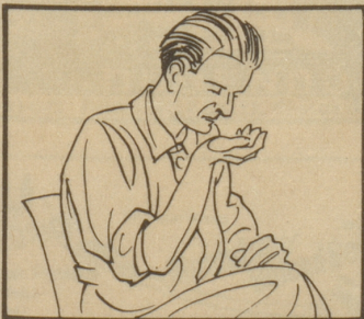
Riechen Sie daran.