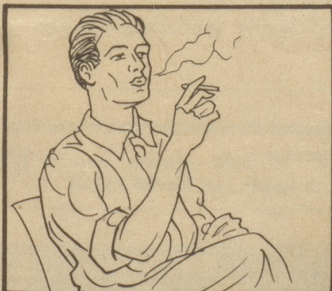
Rauchen Sie eine Marocaine Filter.