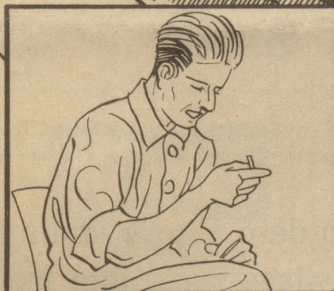
Der Filter ist dunkelbraun geworden.