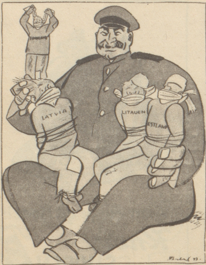
Unterdrückung der Randstaaten! Hat jemand klagen hören?