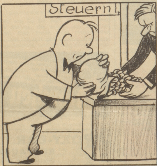
Die unfreiwilligen Abgaben