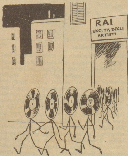
Der Ausgang für die «Künstler» am italienischen Radio.

Welch eine Freude ist es, ab und zu mit Landsleuten zusammenzutreffen! Dabei tauchen immer wieder, in hundertfachen Variationen, dieselben zwei Gesprächsthemen auf: allgemeine Verärgerung über die Militärpflichtersatzsteuer und großes Bedauern, daß schon seit fünfzehn Jahren keine «Grünen», keine jungen Schweizer Berufsleute und Landarbeiter, Melker und — Jodler, in die gutgeführten Schweizerkolonien und Schweizervereine nachströmen.