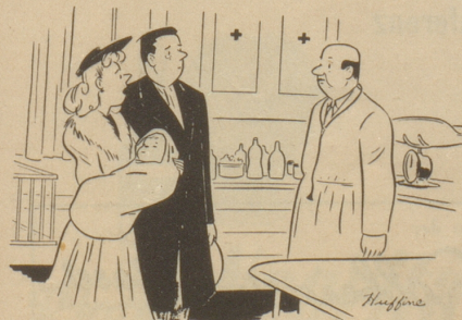
„Er zeigt so gar nichts von einem Genie, Herr Doktor. Ist das normal?“ Esquire

Natürlich finden sich unter den vielen auf Regalen fein säuberlich gestapelten Restposten, andere auf «Restentischen». Alles zum Ausschauen, was ein Frauenherz nur beglücken kann: Hüte, Blusen, Gürtel, Knöpfe und sonstige Okkasione! Diese modischen Utensilien glänzen eigentlich weniger durch ihre moderne Form als durch zeitgemäße und erschwingliche Preise, die das Haushaltbudget nicht übermäßig belasten. Und wie manches verkannte und übergangene Prunkstück des vergangenen Jahres wurde nicht schon von sorgsam Frauenhänden ausgegraben und — am Körper einer schönen Frau ans Licht der Öffentlichkeit gebracht? Wie gut sieht jetzt der alte schwarze Pullover mit dem netten weißen Krägeli für nur .....zig Rappen aus? Und wer würde es dem neuen Hut der Frau Dr. X ansehen, daß er «nur» .... aber das nennt man Occasion, und der Herr Gemahl wird es ihr gewiß nicht verdenken, daß sie ihn diesmal aus dem Haushaltsgeld erstanden hat. Nur einmal im Jahr — ist Ausverkauf und — an einer guten Gelegenheit sollte man niemals achtlos vorübergehen! «Les occasions nous font connaître aux autres, et encore plus à nous-mêmes». (Die Gelegenheiten machen, daß wir von den Mitmenschen erkannt werden — und noch mehr von uns selbst), schrieb der weise Mann und Schriftsteller: La Rochefoucauld! Adelheid Sprecher