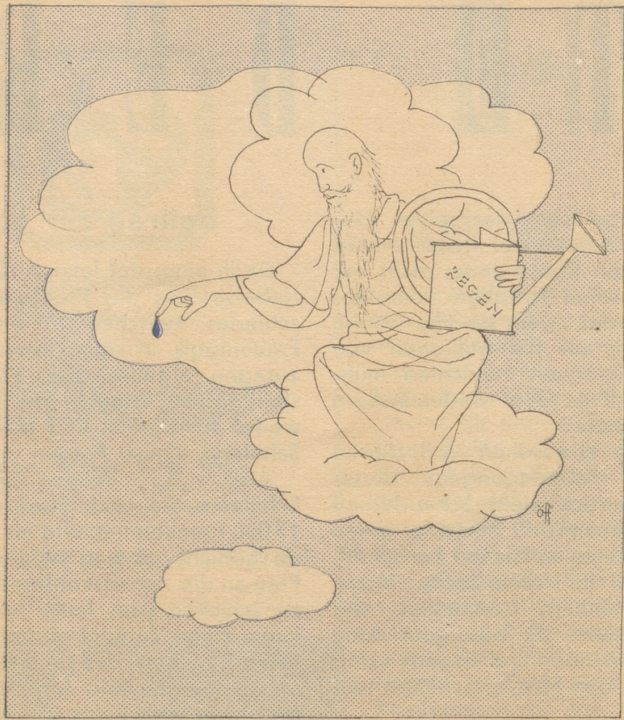
Der alte Petrus trätzelt!

Caran d'Ache Blei- & Farbstifte der Heimat