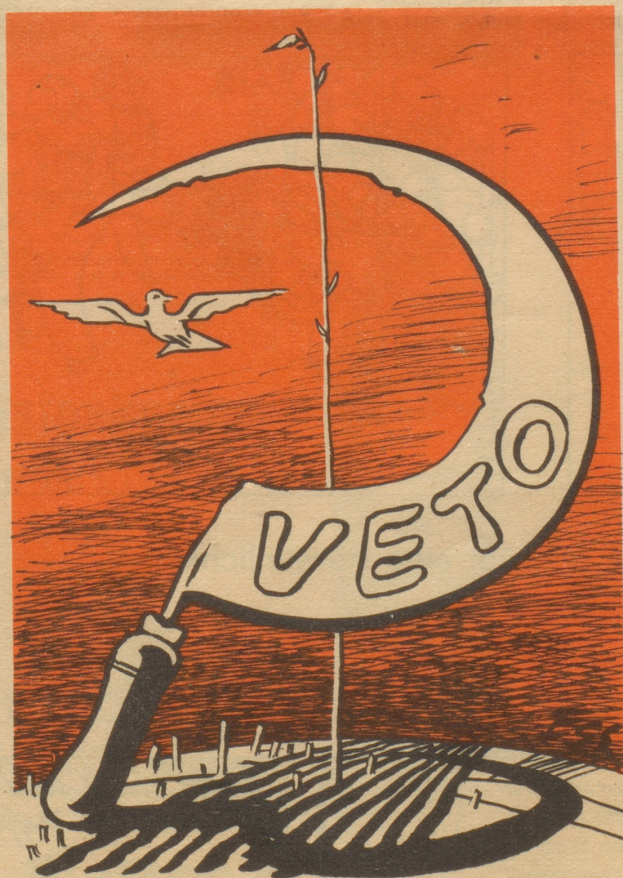
Das bedrohte Friedenspflänzchen

Arbon, Basel, Chur, Frauenfeld, St. Gallen, Glarus, Herisau, Luzern, Olten, Romanshorn, Schaffhausen, Stans, Winterthur, Wohlen, Zug, Zürich. — Depots in Bern, Biel, La Chaux-de-Fonds, Interlaken, Thun