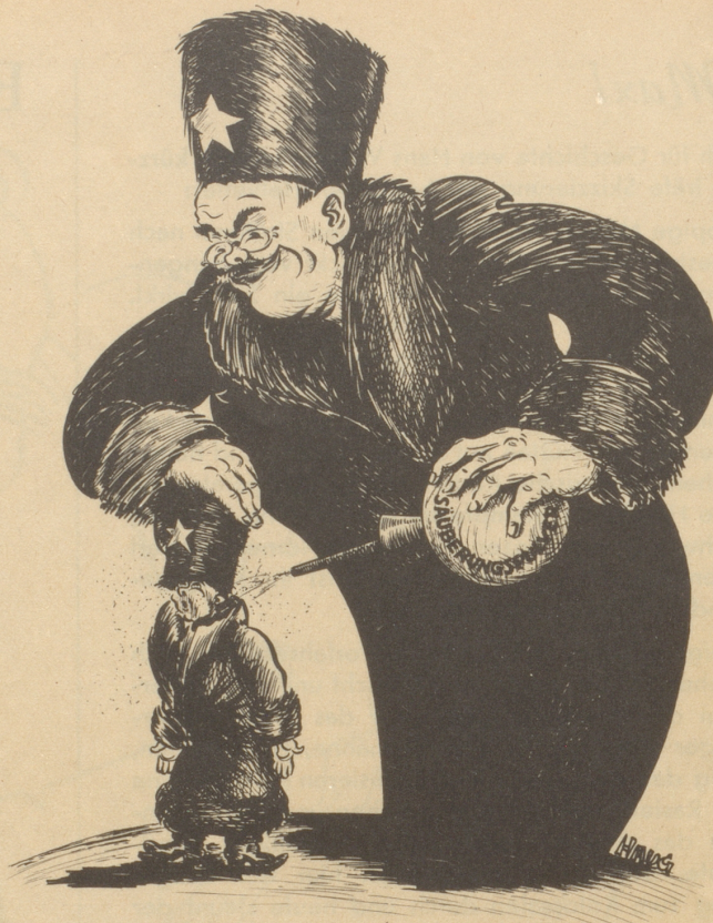
Rumänien ist an der Reihe