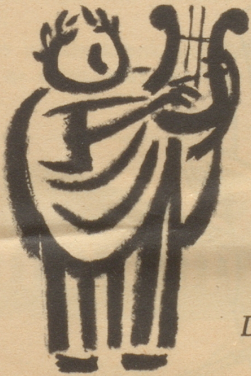
Die nächtliche Toga

Der Mann im Nachthemd! Sein Anblick erinnert ein wenig an den Römer in der Toga. Wie sich dieses stolze Kleidungsstück aber überlebt hat, so ist nun auch das männliche Nachthemd im Begriff, sich als unzeitgemäß zu überleben.