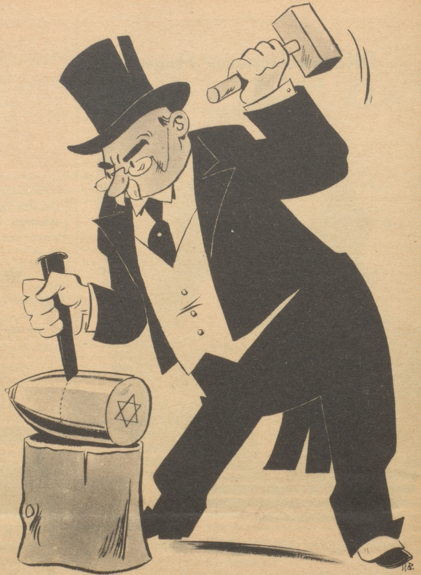
Das Palästina-Komitee beschließt Teilung