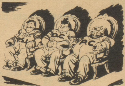
Von links nach rechts: Sozialisten, Christlich-Demokraten, Kommunisten.