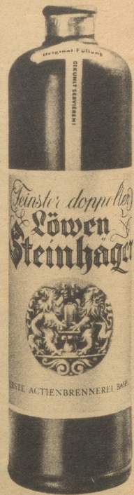
Erste Aktienbrennerei Basel