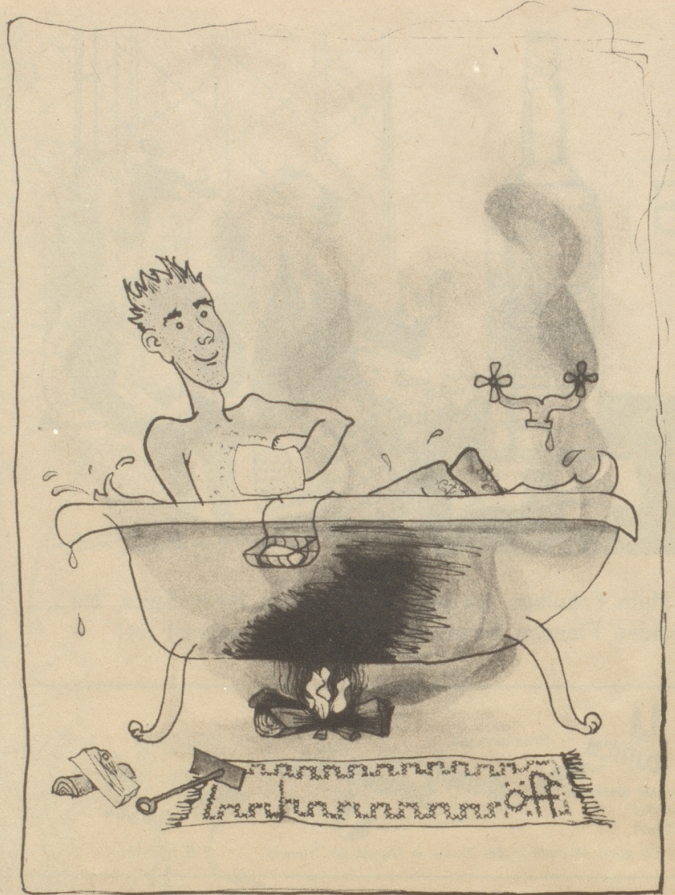
Brennholz frei — Boiler gesperrt!