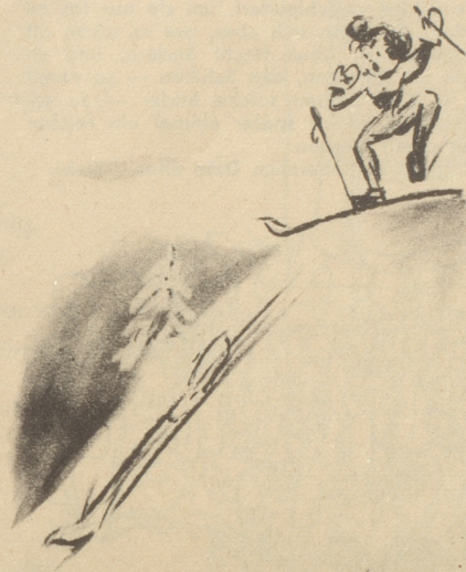
Es Schneebrett hat sich glöst!

«Mister Jean, es steht fest für mich, daß es nicht gerade der glücklichste