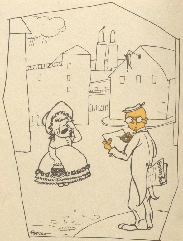
Welches ist der Unterschied zwischen Zürich und Basel? Die Zürcher verbrennen den Böögg, die Basler schicken ihn nach Zürich.