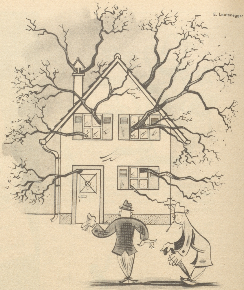
„Jä lueged, dr Naturschutz het verlangt, daß dä Boum da mueß schtaa bliibe.“