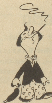
Casimir raucht Capitol

Pully/Lausanne Postversand Postfach Gare, Lausanne