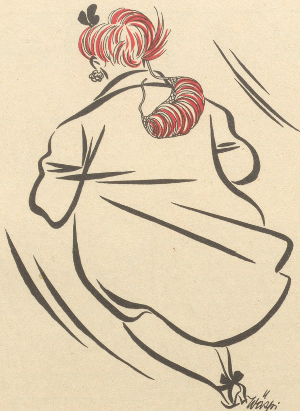
Die neue Haar mode Die ächten wieder obsi, die falschen nidsi.