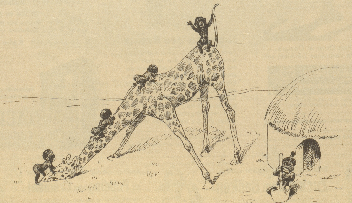
Fern aller Technik