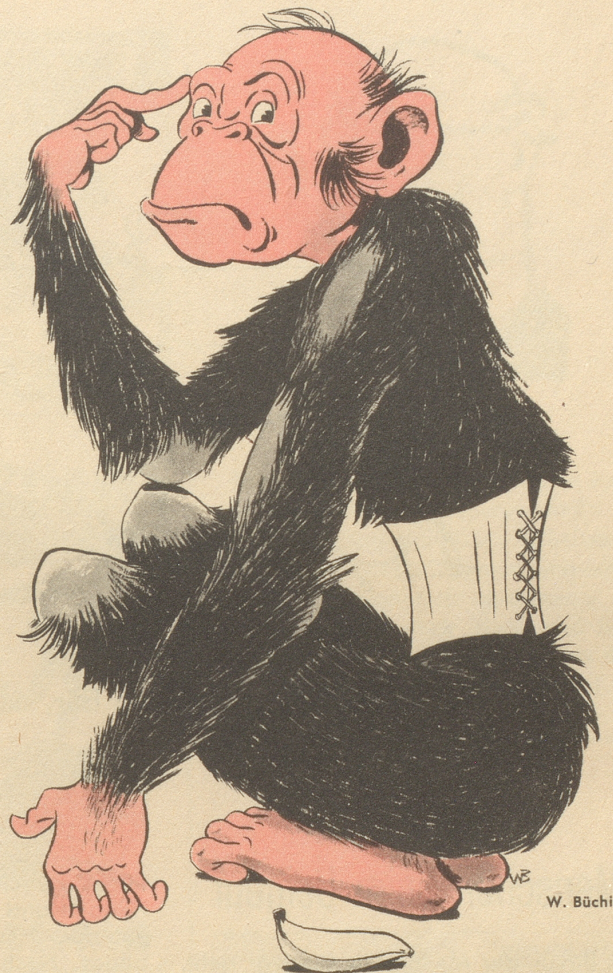
In Jacksonville in den Vereinigten Staaten wurden vierzig Affen mit einem Korsett versehen, das sie zwei Jahre tragen. Die Amerikaner wollen auf diese Weise Erfahrungen sammeln, ob der Schnürleib für die Gesundheit schädlich ist oder nicht.

Weg mit der Krawatte, weg mit schweren und dunklen Anzügen, wenn heißes Sommerwetter das Tragen mittelalterlicher Rüstungen geradezu ver-