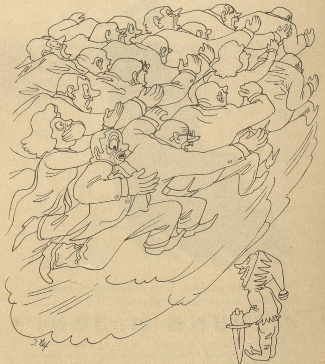
Spalterli: Was isch was isch? Die Masse: 's hât eine d'Woret gsait!