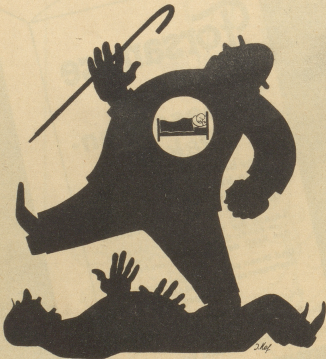
Das gute Gewissen