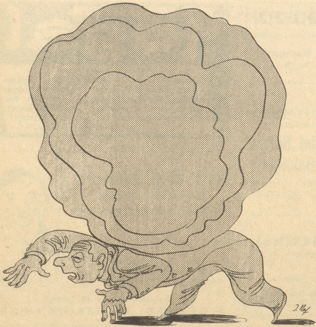
So muß der Pessimist durchs Leben!