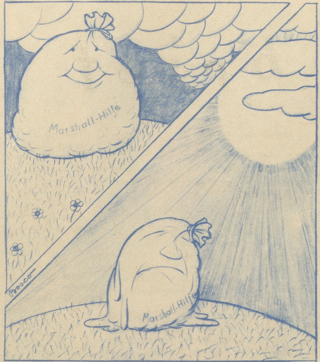
Sie gewinnt nicht durch das Lagern!