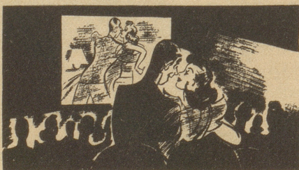
«Jetzt können wir gehen, Schnuggi. Das Ende erzähle ich Dir zu Hause.»

Seid nicht so hartherzig! Schimpft nicht schon wieder, liebe Mitschweizer! Laßt doch der Mode ihren freien Lauf! Bedenkt, es gibt doch Töchterchen wie mich, die sich nun endlich auch unter den Koketten zeigen dürfen, wo vorher ein zu gewaltiger Hüftumfang daran hinderte. Nun ist der ja im Programm!