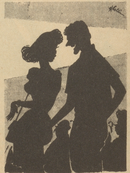
«Fräulein, wissen Sie, wie das Stück endet?» «Ja, mit zwei Ohrfeigen!»