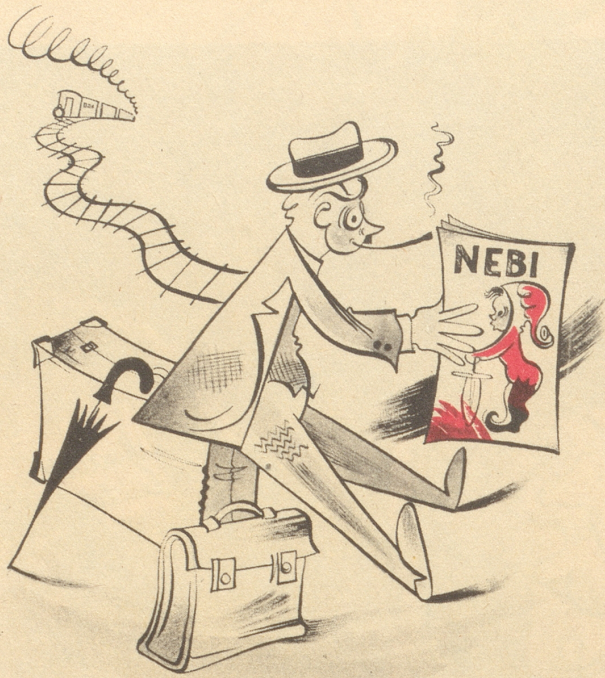
Vergessen Sie trotzdem die Anschlüsse nicht