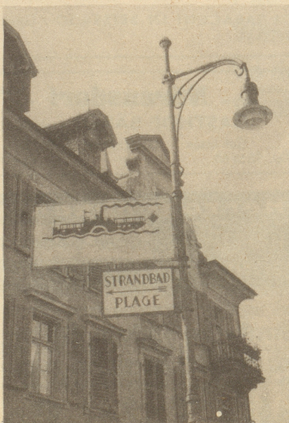
Biel schätzt offenbar die Strandbaderei nicht!