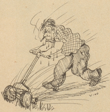
DER RASEN-(DE) MÄHER