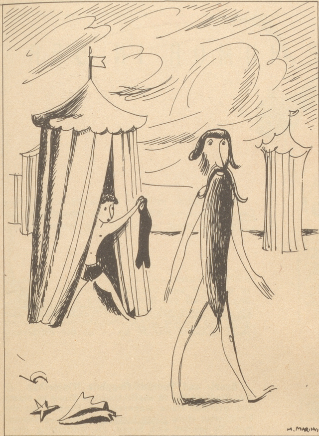
Bappe Du häsch Badhose vergässe!