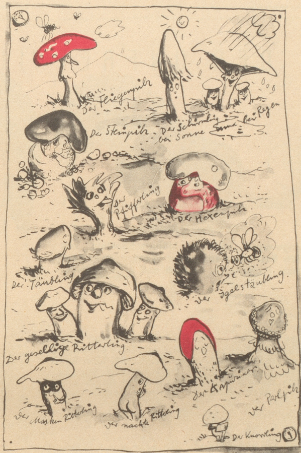
Knorr sieht Pilze