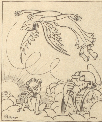
„Es isch halt en Akrobatik-Flüger!“