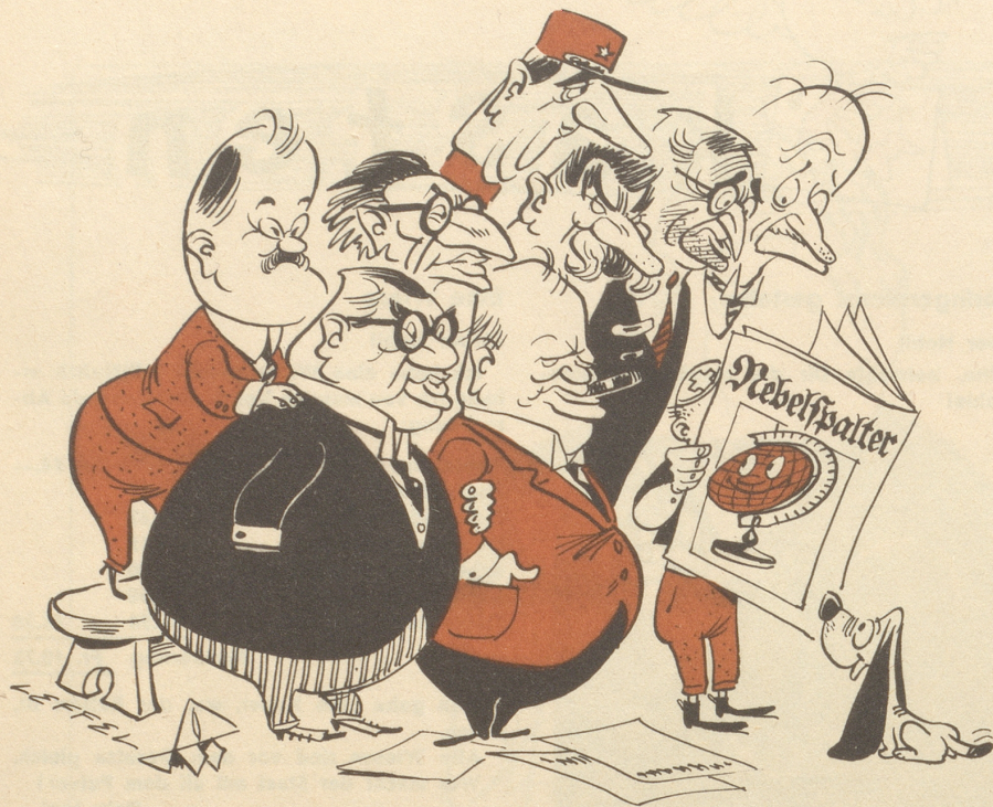
Der schweizerische Nebelspalter hält den Vergleich mit den guten ausländischen humoristisch-satirischen Zeitschriften aus.