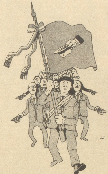
Die Bettelei der Vereine und Clubs nimmt überhand.

Er glaubt, der Schelm, ich könnte ihn Fortan nicht mehr entbehren. Er hat sich bei mir einquartiert, Und ich muß ihn ernähren. Nu