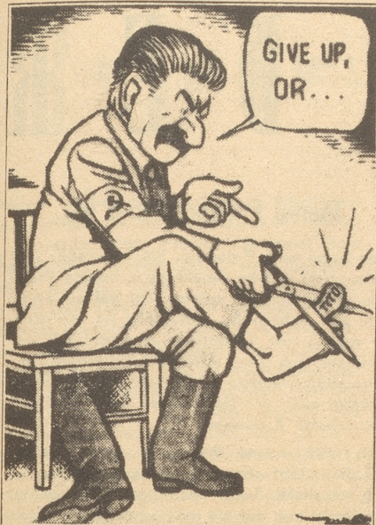
„Gib auf, oder...!“